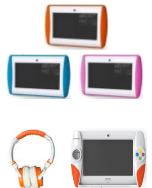
(左)ヘッドフォン、(右)ジョイスティック 各 1,999 円